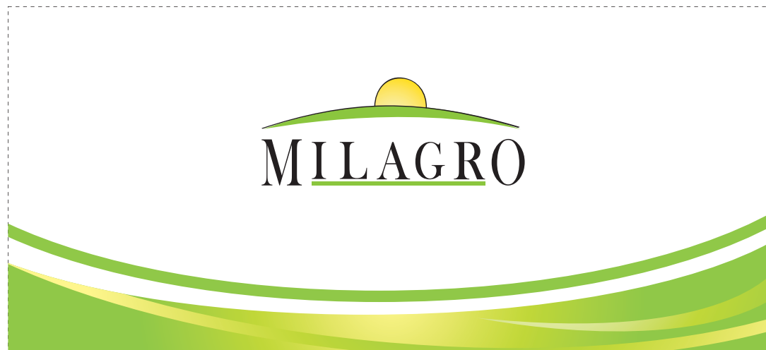
šema štampe u spoljašnjosti šolje