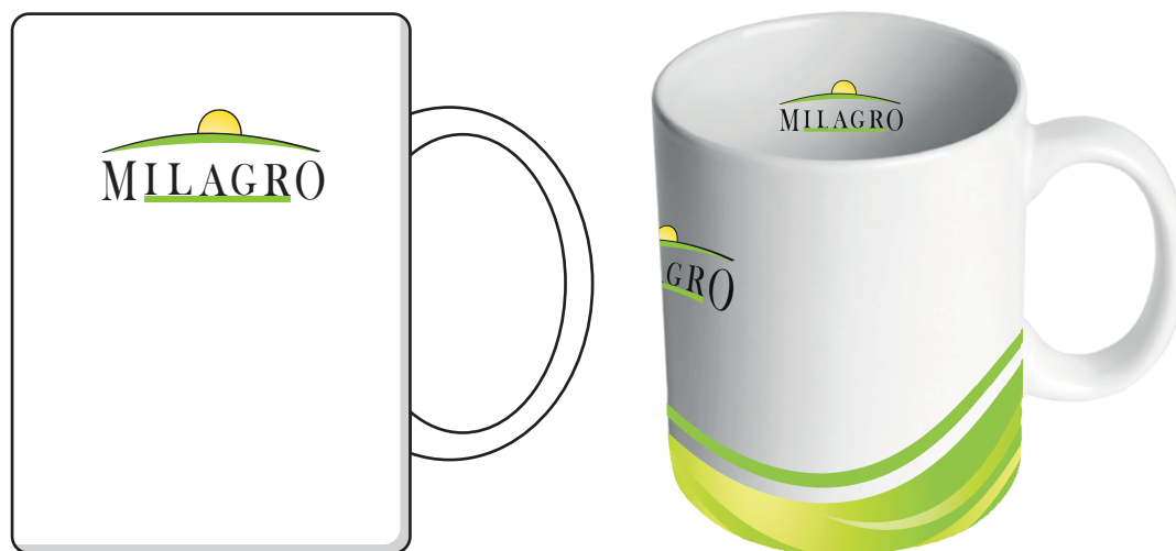
šema štampe u unutrašnjosti šolje štampa se sa obe strane - i levo i desno od ručke